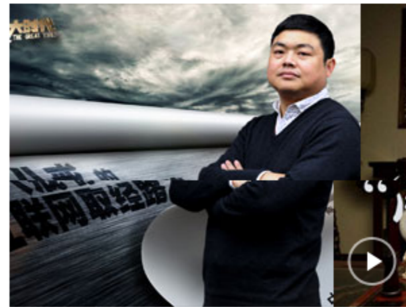
把服务标准化商品化是极大误区