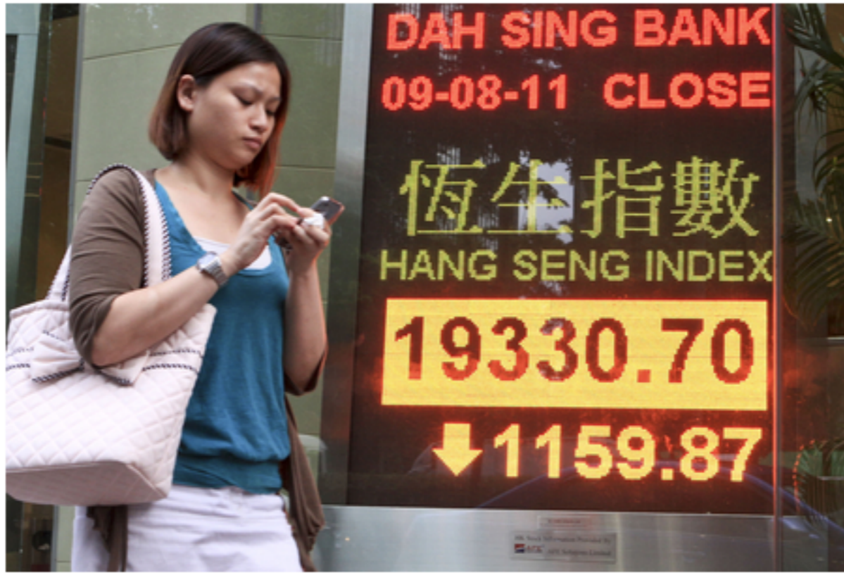
全亚洲市场周二（9月29日）暴跌到三年半最低。人们担忧中国的放缓正蔓延到全球市场。